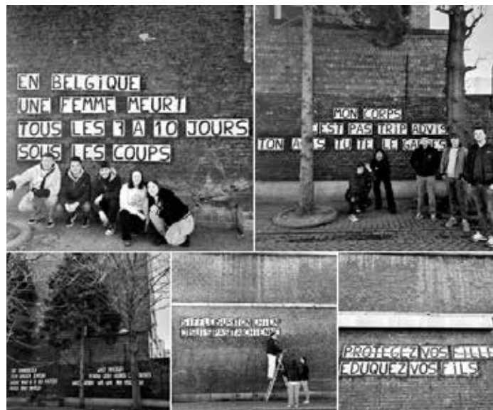
Initiation aux collages féministes animée par Celine Chariot avec les étudiant·es de L'Ecole Supérieure des Arts Saint-Luc Liège, sections Design industriel et Architecture d'intérieur. (Festival de Liège 23)